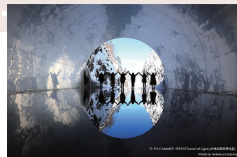
マ・ヤンソン / MADアーキテクト 「Tunnel of Light」(大地の芸術祭作品)