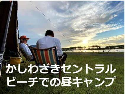
かしわざきセントラル ビーチでの昼キャンプ

タウンインフォメーション 人口81,745人/面積442.03km 2 保育園28園/認定こども園4園 小学校20校/中学校11校/高校5校 病院5カ所/診療所41カ所 公園25カ所