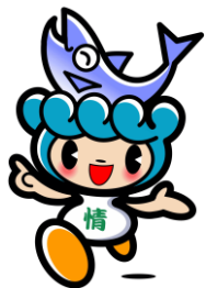
村上市観光 キャラクター 「サケリン」

新潟県の最北端に位置する村上市。豊かな自然と、長い歴史と共に受け継がれてきた伝統と文化を兼ね備えた、魅力ある資源を持ったまちです。季節を通じて村上には、言葉や写真では伝えきれない魅力があふれています。ここには移住生活を思う存分謳歌していただけるあなたにとっての新しい故郷があるはずです。